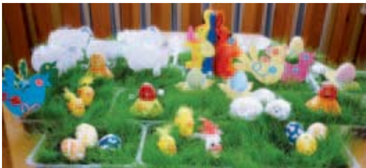
Vítězný velikonoční trávniček 1. třídy MŠ Lučina z Frýdku-Místku

Letošní rok poprvé probíhala soutěž o nejkrásnější velikonoční trávniček, kterou pořádala firma Rožnovská travní semena, s. r. o. Tento projekt měl dětem přiblížit přírodu jiným způsobem, než jak jsou běžně zvyklé.