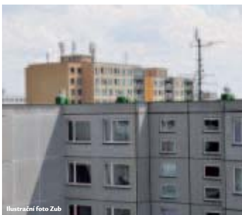
Ilustrační foto Zub

Objem podpořených oprav panelových i nepanelových domů letos dosáhne čtyř miliard korun. Státní fond rozvoje bydle-