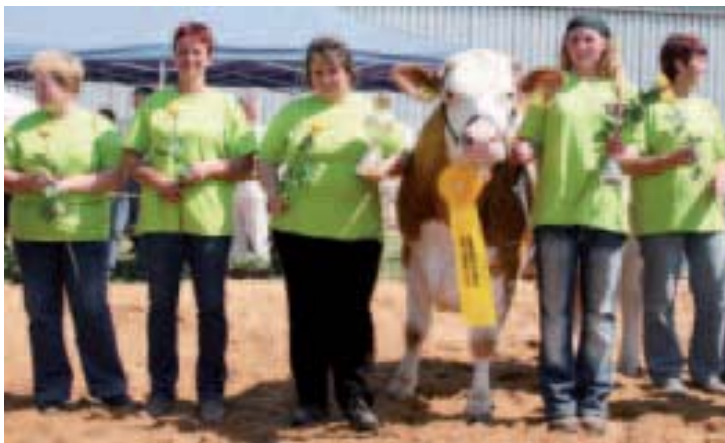
Šampionka soutěže o nejlepší krávu plemene český strakatý skot se svými chovatelkami

„Agrochov Sobotka je už v ČR jednou z mála zemědělských firem, která se živi klasickou zemědělskou činností a dosahuje velmi dobrých výsledků. Samotný Chovatelský den byl pro mne přímo srdeční záležitostí,“ uvedl Veleba. Popsal, jak každého z hostů uvedla do předváděcího některá z krojovaných žen ze spolku místních baráčníků. „Bylo vidět, že místní zemědělci touto činností žijí a svou práci mají rádi. Toho si velice vážím,“ dodal Veleba. Hlavní akcí bylo hodnocení 64 krav plemen český strakatý skot a brown-